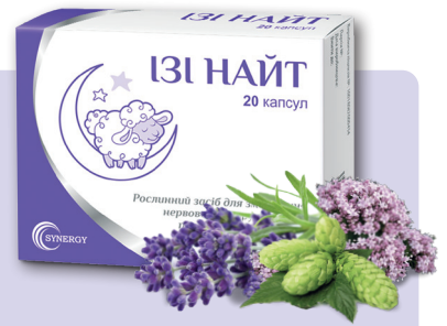
Дієтична добавка. Не є лікарським засобом.

ІЗІ НАЙТ – комплексна допомога в покращенні сну та профілактиці захворювань.