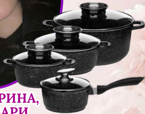
КРИКУН ІРИНА, М. БРОВАРИ