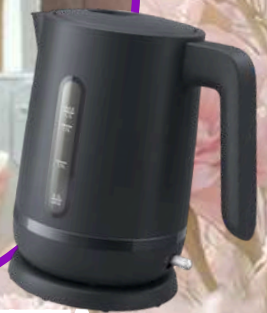
ДІДУСЕНКО ІРИНА, М. ВІННИЦЯ