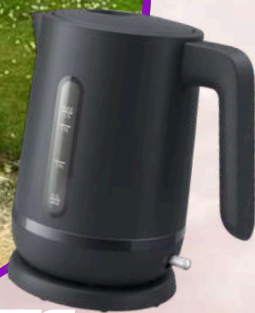
ОЛІЙНИК ЮЛІЯ, М. ЛЬВІВ