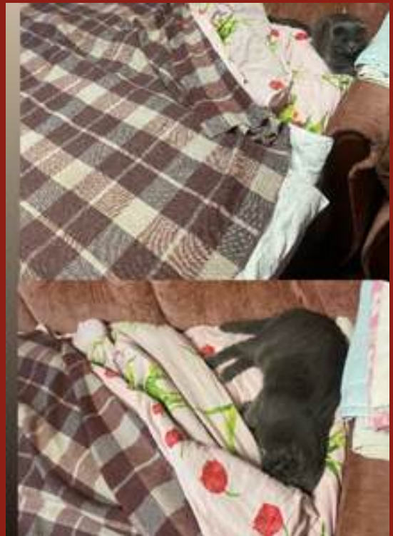
Юрій Катерина, м. Вінниця

Любов - це коли ти так сильно любиш свою вихованку, коли вона лягла на ліжко і ти не можеш через свою любов до неї зігнати її, і твоє ліжко тоді виглядає так!