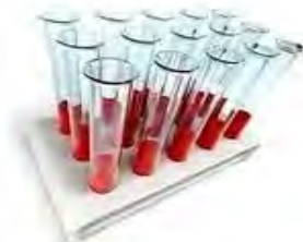
загальний аналіз крові