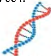
полімеразна ланцюгова реакція