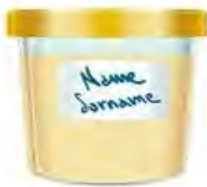
загальний і бактеріологічний аналіз сечі